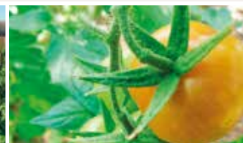
1η – 3η ταξιανθία Δέσιμο καρπών