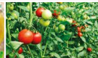
3η – 5η ταξιανθία Δέσιμο καρπών