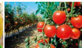
3η – 5η ταξιανθία Δέσιμο καρπών