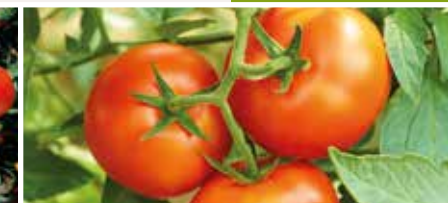
6η ταξιανθία έως κλείσιμο καλλιέργειας