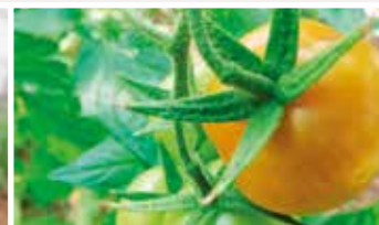
1η – 3η ταξιανθία Δέσιμο καρπών